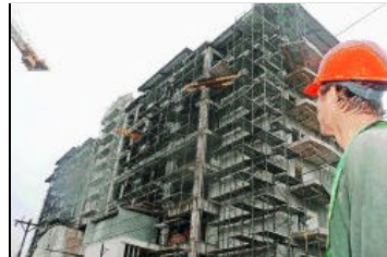
Nuevos edificios, como Vista de Mar, en Jacó, han sido el principal factor de progreso de algunos cantones.

Álvaro Murillo M. alvaromurillo@nacion.com